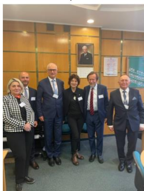
V Sesja Problemowa p.t.: Działania towarzystw medycznych na rzecz poprawy zdrowia społeczeństwa III Kongres Towarzystw Naukowych Gdańsk 20-22 październik 2022 r.

Powyższe zdjęcie przedstawia Wykładowców Sesji „Działania Towarzystw Medycznych na rzecz poprawy zdrowia społeczeństwa” III Kongresu Towarzystw Naukowych w Gdańsku.