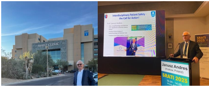
Zdjęcie z wizyta w Mayo Clinic (USA) oraz z wykładu na Kongresie Anestezjologów w Sinaia (Rumunia)